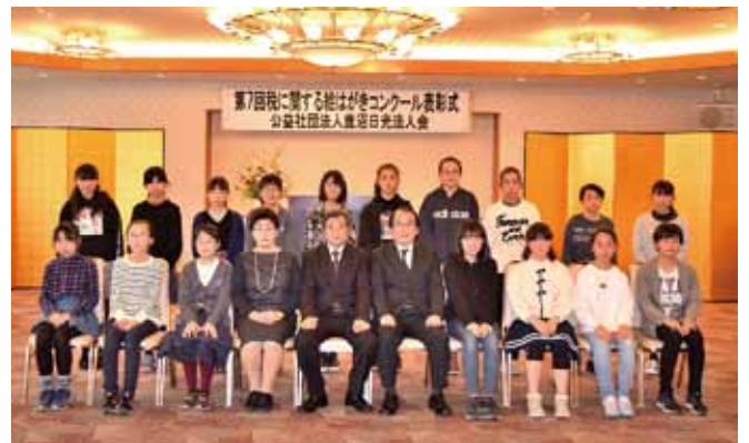
第7回税に関する絵はがきコンクール表彰式

来年度も、多くの小学生に応募いただけるよう、ご協力ご支援いただきますようお願いいたします。