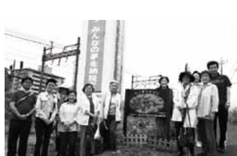
【日光・足尾ブロック】(6月6日) 社会貢献事業…植樹と除草作業