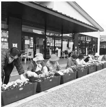
【今市ブロック】(5月24日) 社会貢献事業…花いっぱい運動