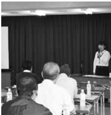
【決算説明会・軽減税率制度説明会】 (7月6日…日光支部)