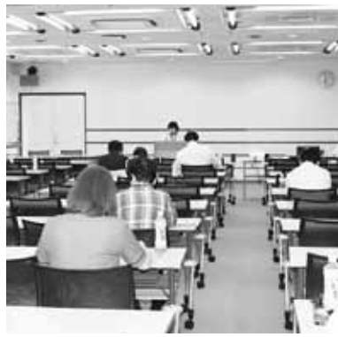
【決算説明会・軽減税率制度説明会】 (7月3日…鹿沼支部)