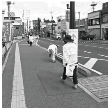
【今市ブロック】(5月24日) 社会貢献事業…クリーンキャンペーン