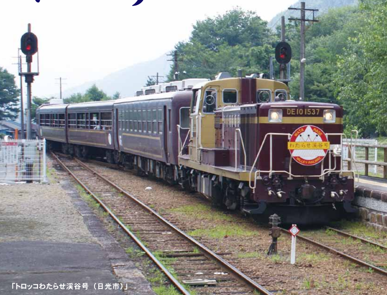
「トロッコわたらせ渓谷号（日光市）」