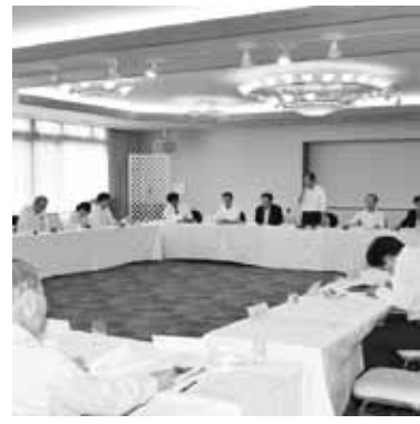
【第1回理事会】(5月18日) 事業報告、決算書類等承認を決議