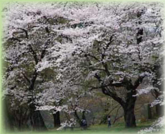
春爛漫（鹿沼市さつき大通り）