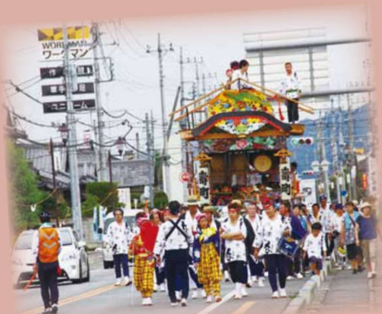
楡木大杉神社の夏祭り（鹿沼市）