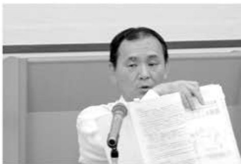
熱心に説明する税務署担当官