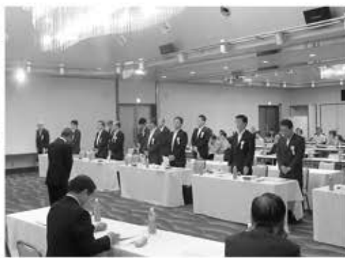
感謝状を受ける団体各位