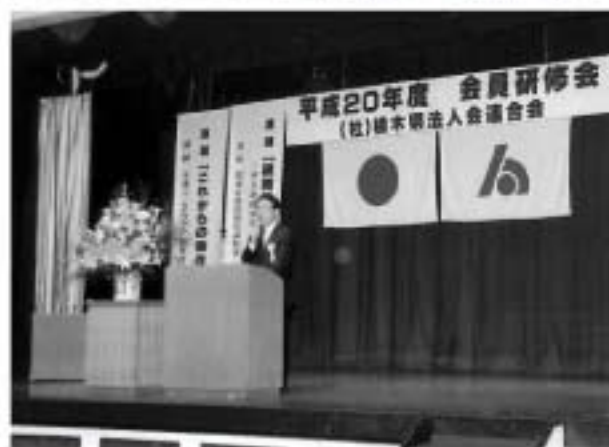
会員研修会(県法連) 9月11日～12日 於ホテルニュー岡部