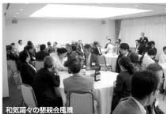
和気雨々の懇親会風景