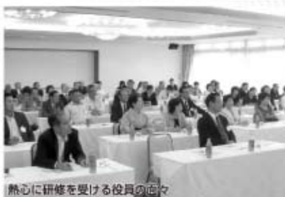
熱心に研修を受ける役員の方々