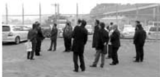
係員より説明を聞く参加者

去る12月9日(火)今年度親会が社団化20周年を迎えたことを記念して、横須賀海上自衛隊見学会を実施した。当日は、宇都宮の自衛隊から2名の方にご同行いただき海上自衛隊「横須賀地方総監部」を見学した。着岸しているイージス艦等を目前に参加者達は熱心に係員の説明を聞いていた。