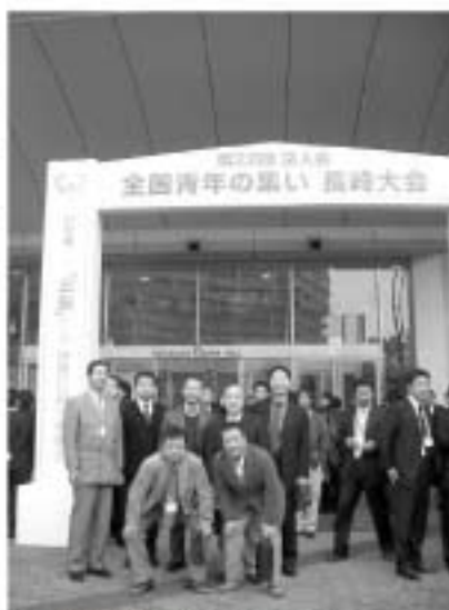
当会からの参加者 会場前にて