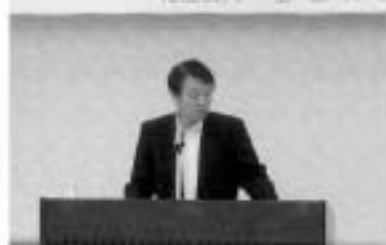
講話を行う遊佐税務署長