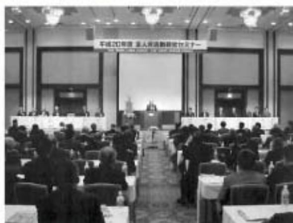
法人会活動研究セミナー(全法連) 11月26日 於茨城県水戸市