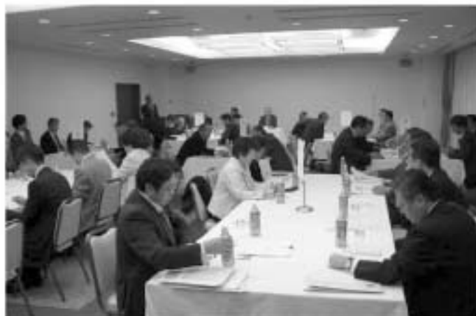
真剣に行動計画を検討する「会員増強検討会」の会場風景

参加した役員並びに組織委員は地区独自の行動計画を協議し、検討会においてそれを発表し今年度後半に向けての会員増強運動が活発化することに期待を持って検討会を終了した。