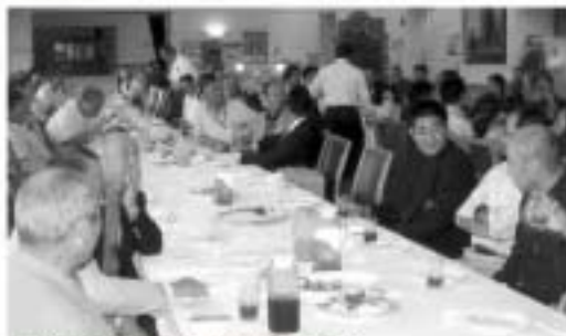
表彰式も終わって和やかに懇親会