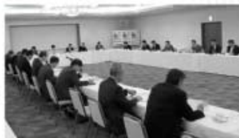
慎重審議の理事会風景

また、報告事項では、「社団化20周年記念事業」「上期実施事業報告」の報告があり、続いて「e-taxの普及拡大」について鹿沼税務署生方統括官より説明があった。