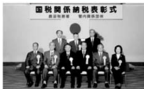
会長感謝状を受賞された皆さん