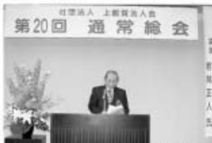
来賓挨拶する中津鹿沼商工会議所会頭