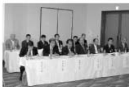
ご臨席いただいた来賓の方々