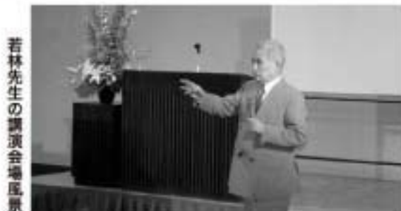
若林先生の講演会場風景