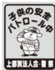
「子供の安全パトロール中」掲げ札