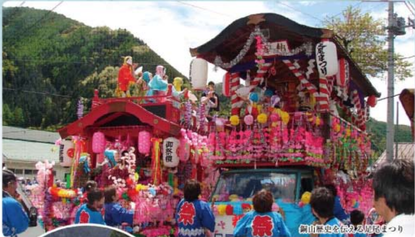
銅山歴史を伝える厄尾まつり