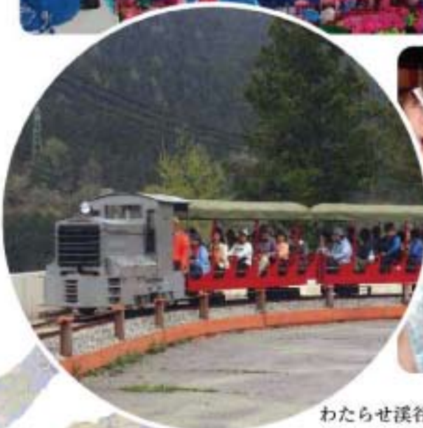
わたらせ渓谷鉄道通洞駅まつり