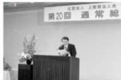
来賓挨拶する造佐税務署長